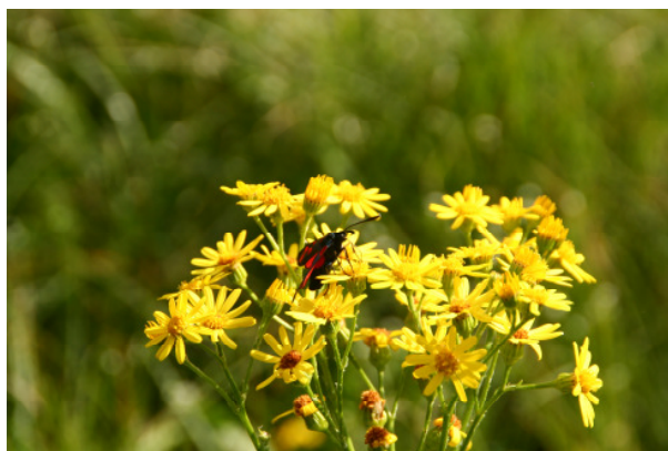
Senecio (Greißkraut)