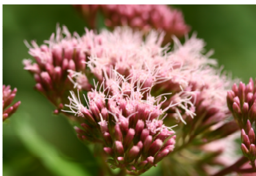
Eupatorium (Wasserdost)

Honig: Von den kritischen Pflanzengattungen sind Echium (Natternkopf) und Borago (Borretsch) aus der Familie der Boraginaceae sowie Eupatorium (Wasserdost) aus der Familie der Asteraceae Bienenährpflanzen, die intensiv von Bienen befliegen werden. Obwohl Senecio -Arten (u.a. Jakobs-Kreuzkraut ) nicht zu den klassischen und eher unattraktiven Bienenweidepflanzen gehören, wurden PA aus Senecio -Arten bereits in Honig nachgewiesen.